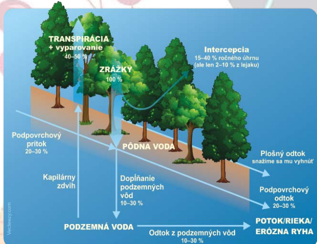
OBR. 1 ZLOŽKY VODNEJ BILANCIE LESNÉHO EKOSYSTÉMU A ICH PODIEL NA ODVEDENÍ ROČNÉHO ZRÁŽKOVÉHO ÚHRNU